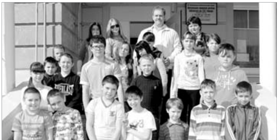
Подготовила Таня МОРОЗОВА.

Н. Воробьева по поручению жителей дома 95 по ул. Суворова.