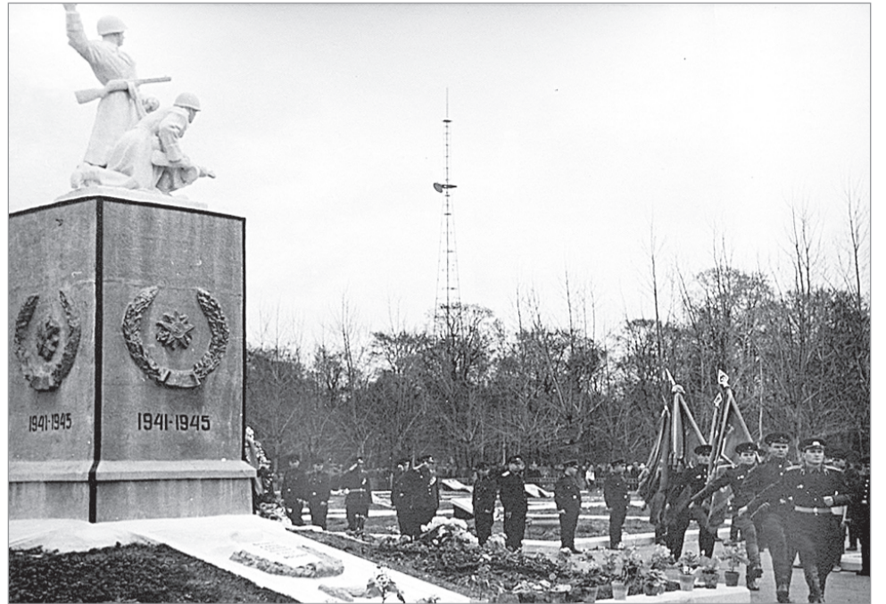
8 мая 1965 года

В том же 1965 году к восточной окраине воинского кладбища были перенесены останки двадцати калужан, казнённых в начале ноября 1941 года, которые с 1942 года были захоронены