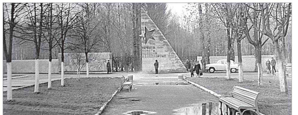
1975 год. Вход на воинское мемориальное кладбище со стороны улицы Чичерина

в Комсомольском сквере (ныне им. Воронина), напротив современной школы №14. На новой памятной доске с именами казнённых указаны фамилии (да и то с ошибками) только 16 человек из 20. К нему ведёт небольшая бетонная лестница и дорожка, которая упирается... в металлический забор воинского мемориала. За этим забором можно увидеть большую белую стелу с выбитыми фамилиями казнённых.