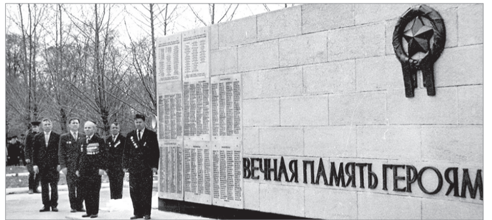
8 мая 1965 года. Открытие Стены памяти