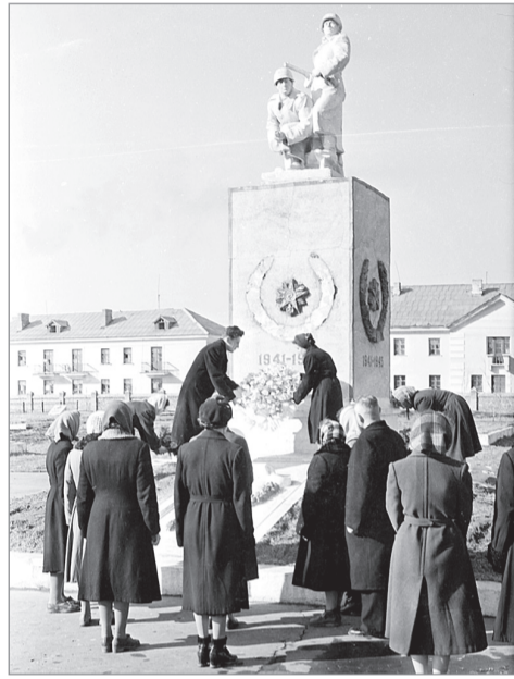
Памятник «Сталинградцы», 1960 г.