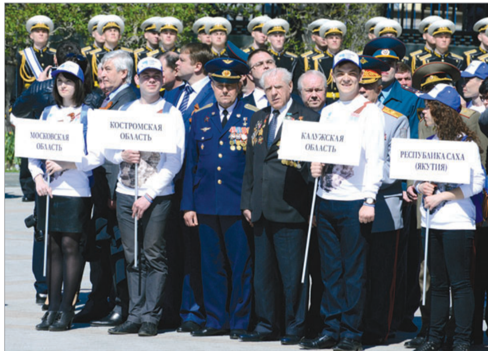
Среди участников – делегация калужан