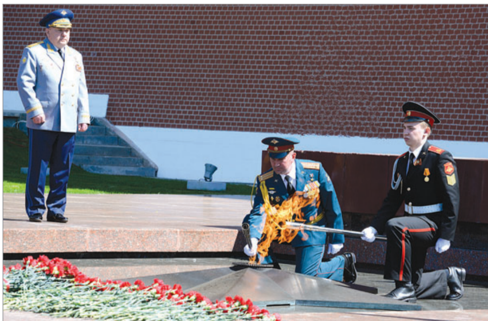
Момент зажжения факелов. Слева командующий ВДВ генерал-полковник В. Шаманов