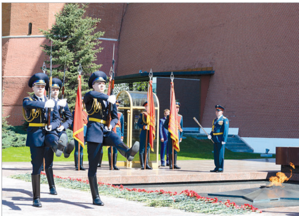
Почетный караул доставил факелы