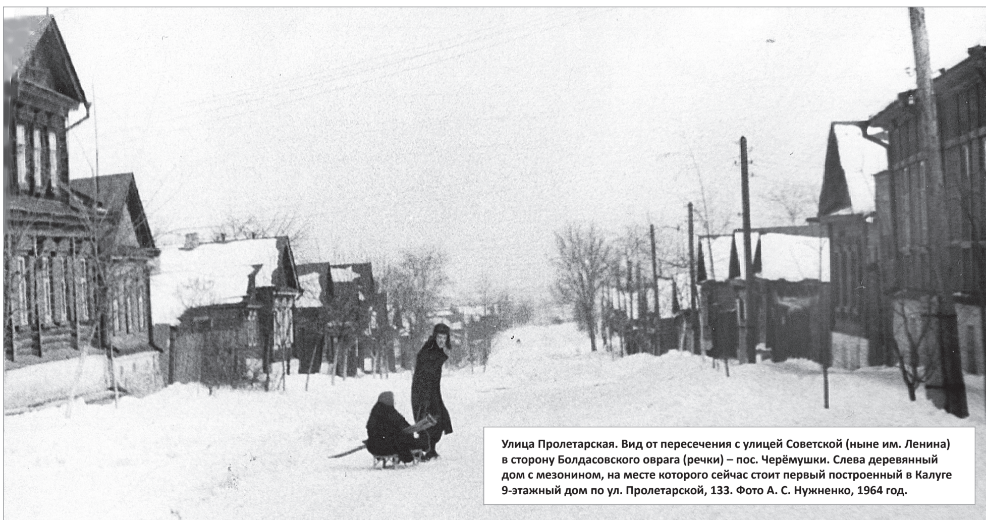
Улица Пролетарская. Вид от пересечения с улицей Советской (ныне им. Ленина) в сторону Болдасовского оврага (речки) – пос. Черёмушки. Слева деревянный дом с мезонином, на месте которого сейчас стоит первый построенный в Калуге 9-этажный дом по ул. Пролетарской, 133. Фото А. С. Нужненко, 1964 год.