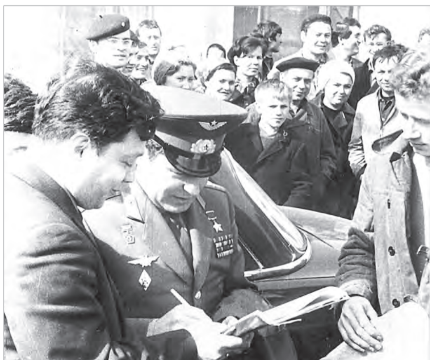
Герман Титов даёт автограф калужанину, 1962 год.