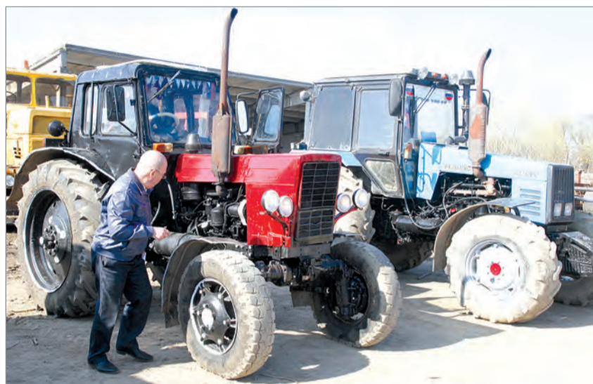
Для работы в полях техника подготовлена на отлично.