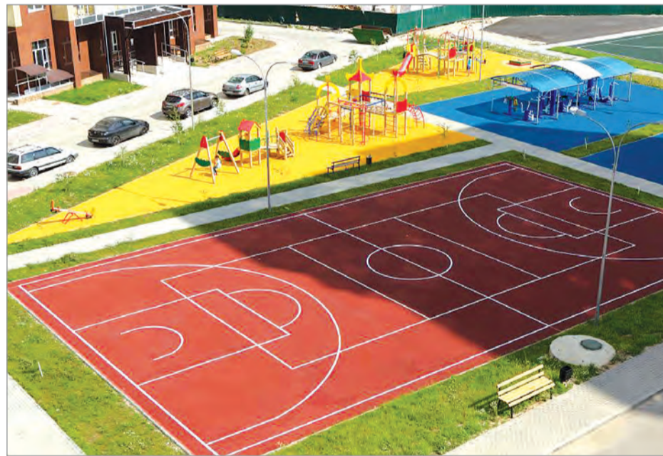
По программе «Городская среда» на Правобережье будут благоустроены общественные территории.