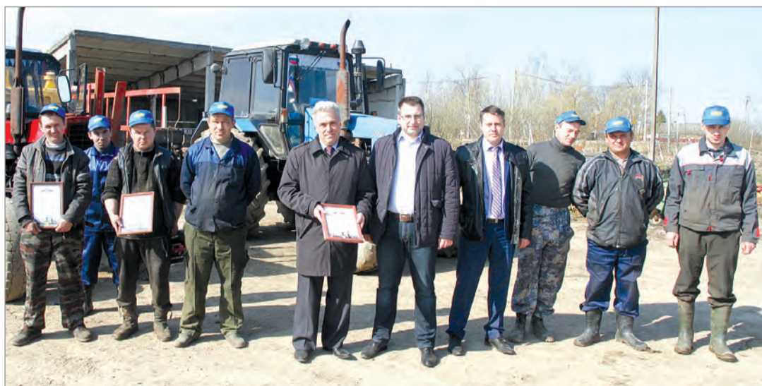
Городская Управа отметила лучших механизаторов.