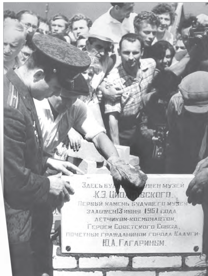
Юрий Гагарин при закладке музея космонавтики, 1961 год.