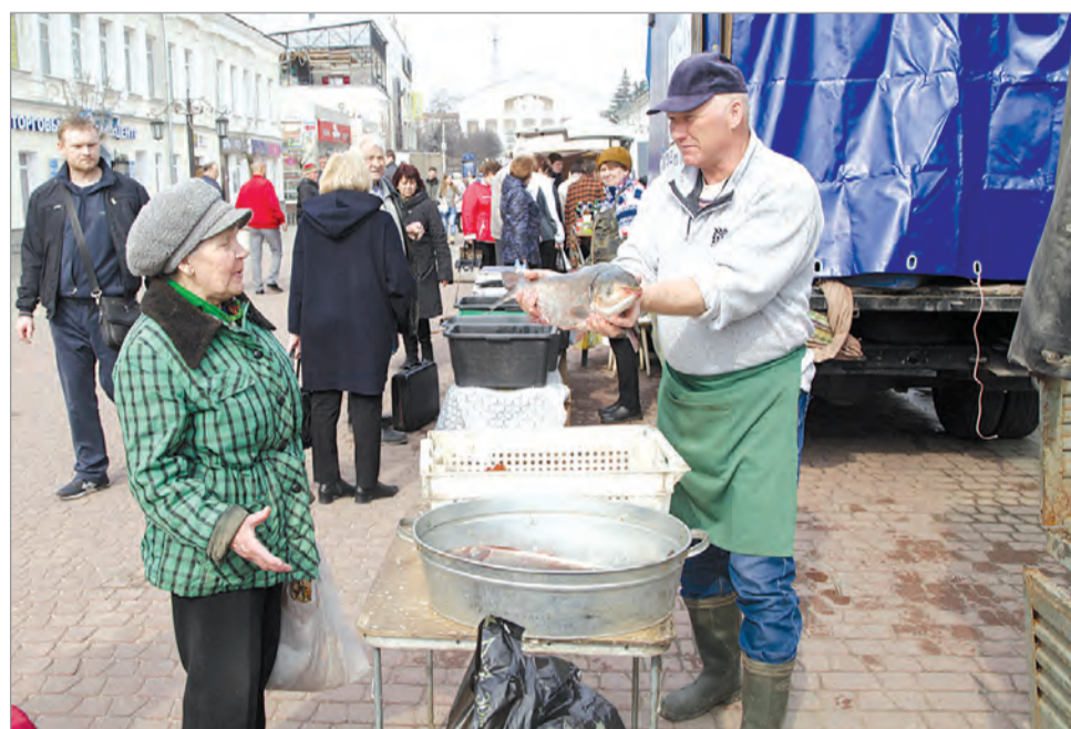
Из районов в Калугу привезли живых карпов.