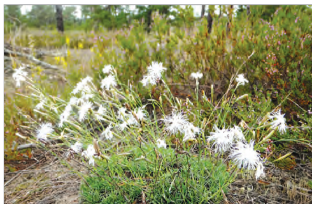
В нашем регионе есть уникальные цветы, вроде белых диких гвоздик.

Акция «Найти и сохранить» стартует в регионе в апреле.