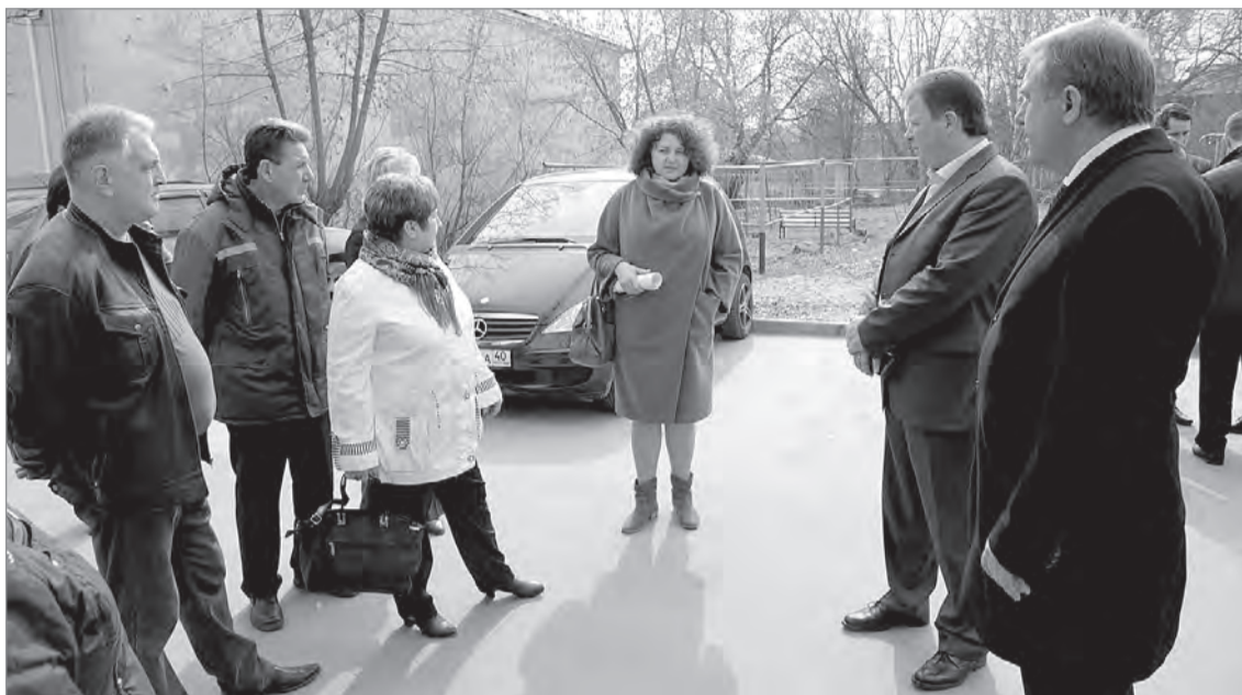
Жители домов, в которых был сделан капремонт, поделились с градоначальником Константином Горобцовым своими впечатлениями о работе подрядчиков и высказали замечания.