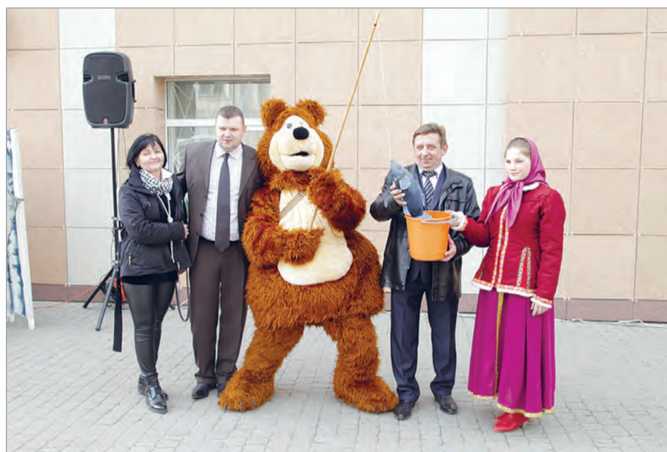
Развлекали гостей праздника ростовые куклы.