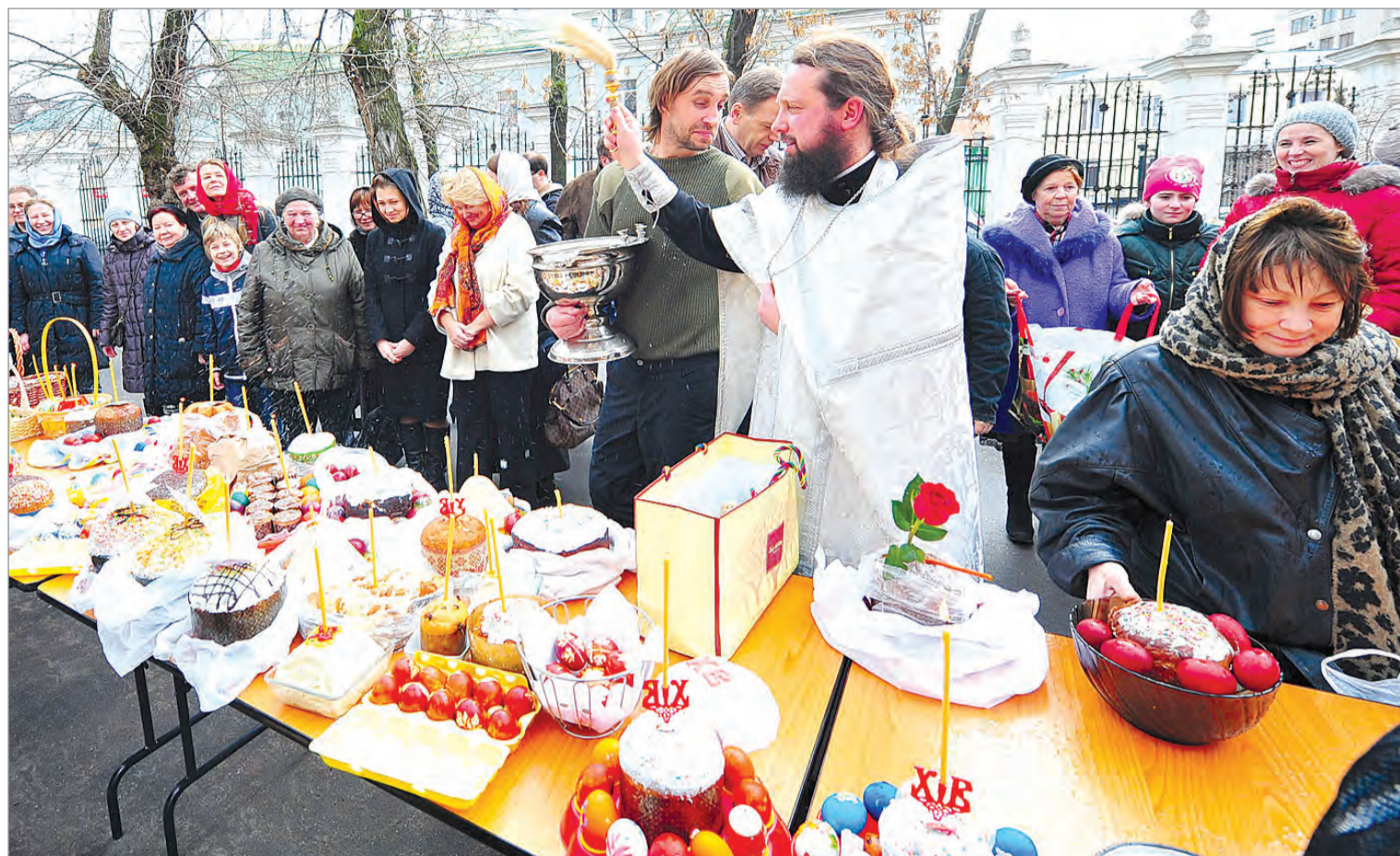
Накануне праздника россияне приходят в храмы освятить куличи и яйца.

В ночь перед Великим Христовым Воскресением, празднуемым в этом году 16 апреля, во всех храмах города пройдут праздничные богослужения.