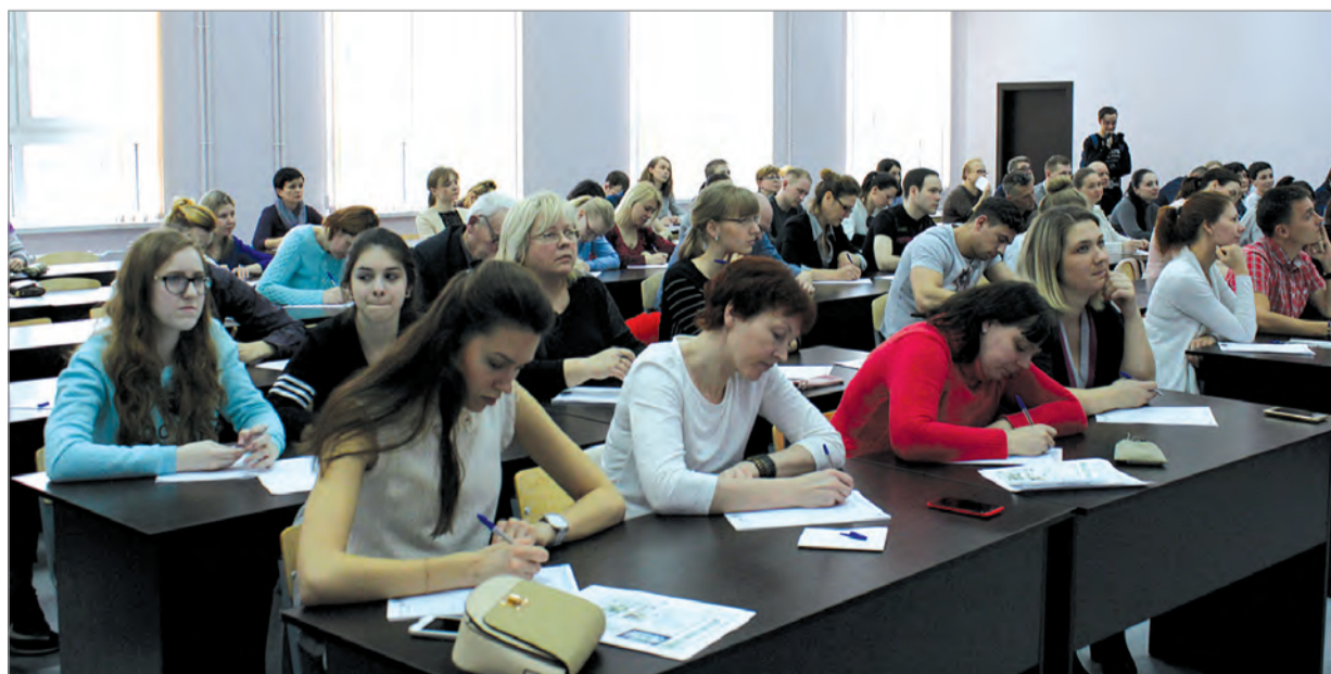
Проверить свою грамотность пришли калужане самых разных возрастов.

В субботу, 8 апреля, в Калуге и еще 584 населенных пунктах страны открылась площадка теста «Тотальный диктант», на которой каждый, кто заранее зарегистрировался, мог проверить свою грамотность.