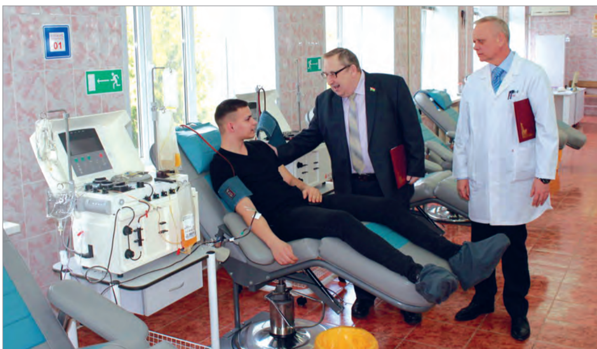
На станцию для сдачи крови приходят люди разных профессий и возрастов.

ром может стать не каждый желающий. Противопоказания для сдачи бывают абсолютные – наличие инфекционных и хронических заболеваний и относительные – когда человек накануне переболел гриппом, злоупотреблял спиртным, перенес операцию и так далее.