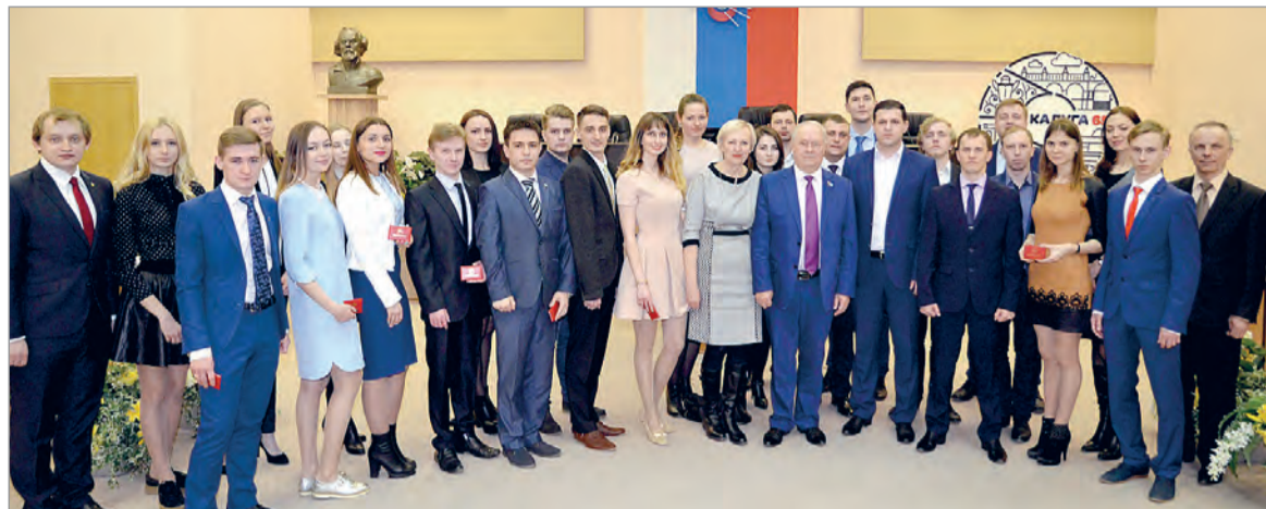
В состав Молодежной палаты при Городской Думе входят лучшие представители калужской молодежи.

родской Думе Калуги начала свою работу в 2014 году. Это был первый созыв. Главная цель – вовлечение молодежи города в активную политическую и общественную деятельность. Сегодня мы можем