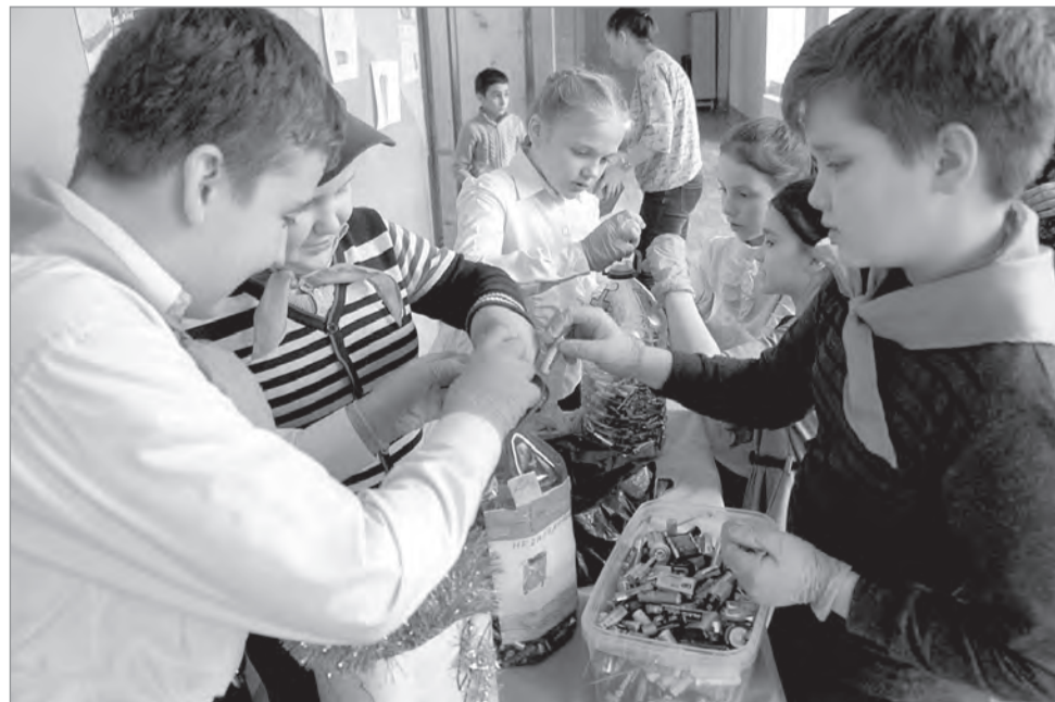
Дети проявили активность в сборе отслуживших батареек и собрали их более 100 килограммов.