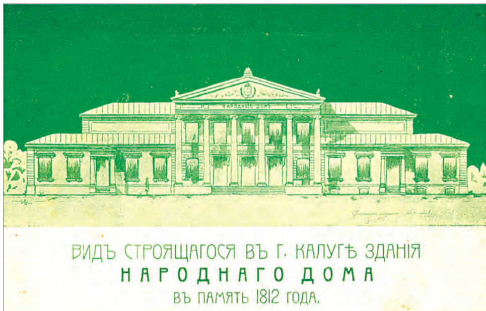
ВИДЬ СТРОЯЩАГОСЯ ВЪ Г. КАЛУГѢ ЗДАНІЯ НАРОДНАГО ДОМА ВЪ ПАМЯТЬ 1812 ГОДА.

Валерий ПРОДУВНОВ