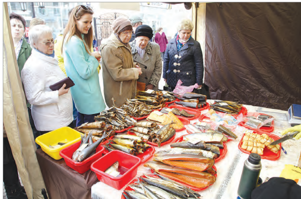
К прилавкам за вкусным товаром выстраивались очереди.

Фестиваль продлился два дня и вызвал большой интерес у калужан.