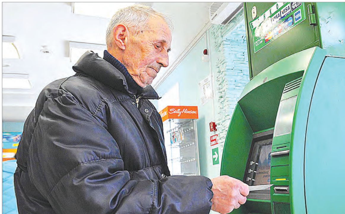
Пластиковые карты становятся среди людей пожилого возраста все востребованнее.

оформили кредитную карту, но не истратили ни одной копейки, то платить за пользование кредитом не нужно. Это не совсем так. Пока вы не воспользовались картой впервые, никакие проценты по ней не начисляются. Но если вы хотя бы один раз вставили карту в банкомат, например, чтобы проверить, какая вам доступна сумма, карта активируется, а банк начинает взимать все полагающиеся платежи, например, платежи за обслуживание карты, которые также могут списываться с заемных средств, и исходя из этого возникает задолженность по карте. В связи с этим, прежде чем оформлять кредитную карту, необходимо все как следует обдумать, не оформлять ее «на всякий случай», просто потому, что банк предложил. А уж если оформили – соблюдать все правила выплаты кредита, оговоренные в договоре с банком об открытии карты. Договор необходимо внимательно прочитать, прежде чем его подписывать.