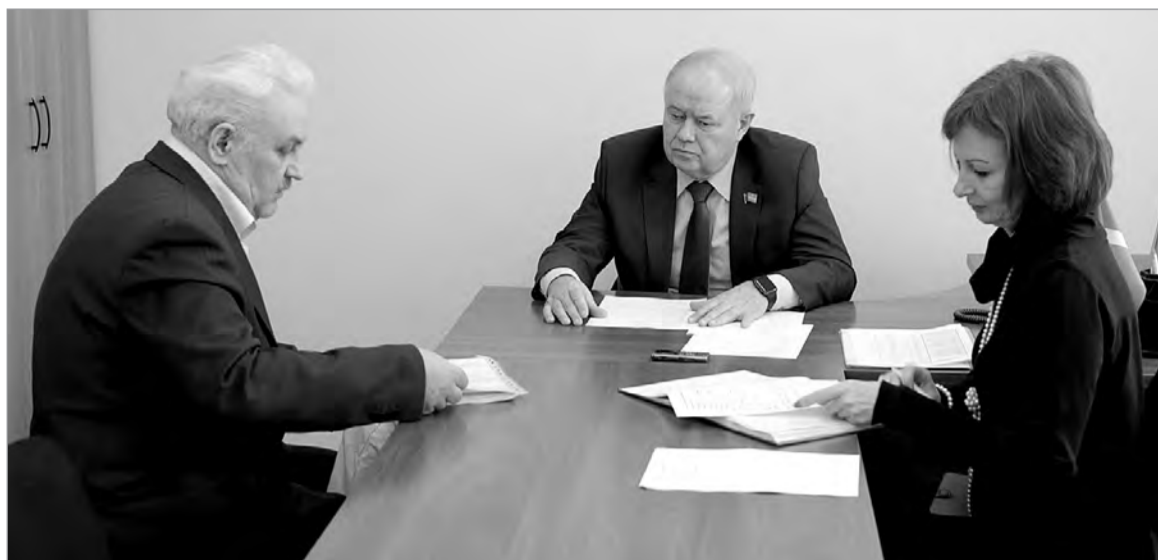
В ходе личного приёма одними из главных были проблемы ЖКХ.

В ходе приема не остались без внимания и вопросы ЖКХ. Одну