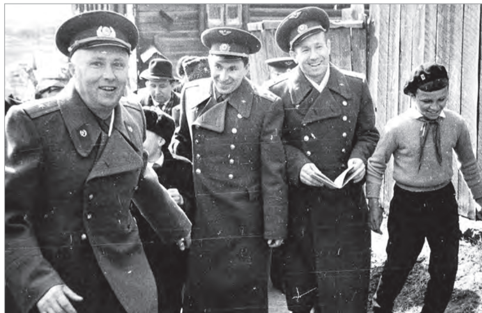
Космонавты П. Беляев, А. Леонов (в центре) у Дома-музея К. Э. Циолковского.