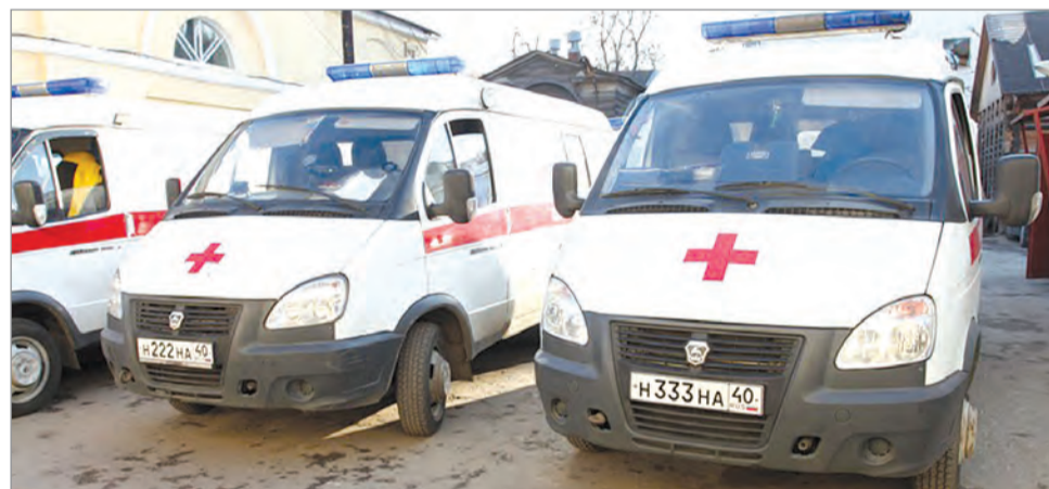
Медики скорой помощи оснащены «тревожными кнопками».

Для региональных медиков разработали рекомендации поведения в конфликтных ситуациях. Над брошюрой работали сотрудники регионального минздрава, врачи областной психиатрической больницы и психологи.