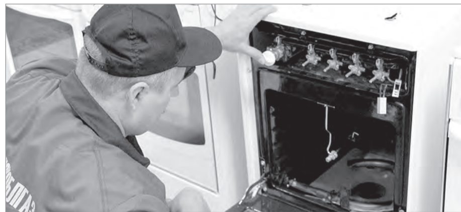
Специалист Горгаза отметил нарушения при эксплуатации внутриквартирного газового оборудования.

Согласно графику поквартирных обходов, утвержденному на 2017 год, 3 апреля специалисты управления по работе с населением на территориях совместно со специалистами Государственной жилищной инспекции Калужской области, АО «Газпром газораспределение Калуга» в г. Калуге, ЖРЭУ № 8 провели рейд по проверке состояния внутриквартирного газового оборудования в переулке Малинники, д. 9.