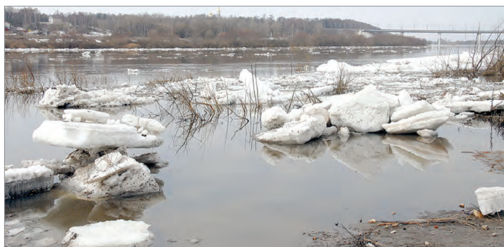
Вешние воды Оки.