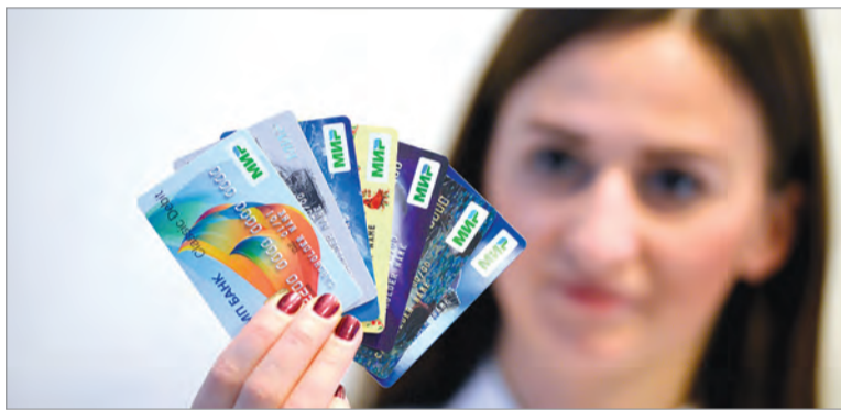
Главное – правильно определиться с выбором – для чего нужна карта.

– Правда ли, что пенсионные выплаты можно получать