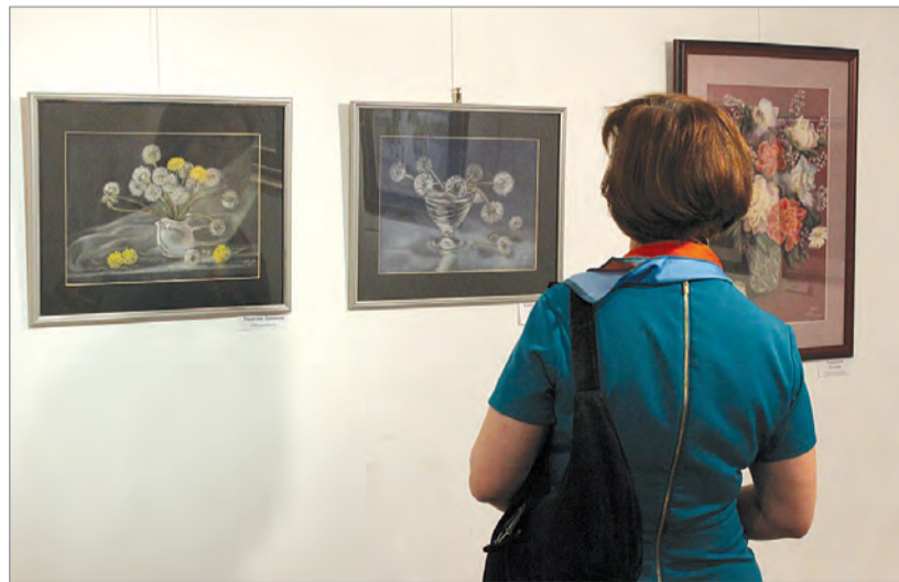
На выставке в галерее Дома музыки.

Художественная выставка «Этюды пастелью» открылась в четверг, 6 апреля, в галерее Калужского Дома музыки.