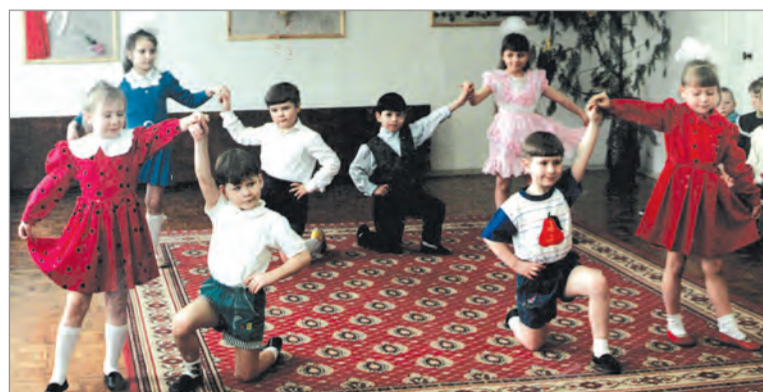
Утренники в саду всегда проходят весело.

Программа «Адаптация начинающих педагогов к дошкольному учреждению» предназначена для