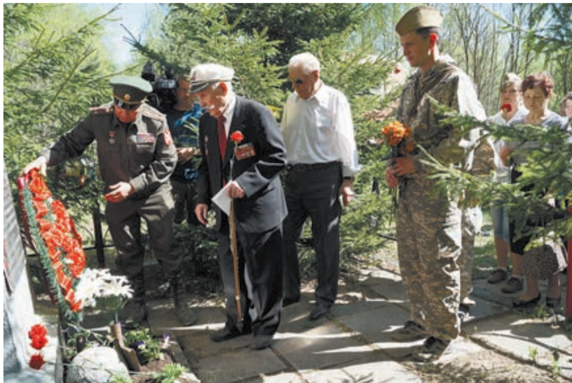
Цветы к могиле героев – дань памяти и уважения.

Участники автомотопробега посетили могилу четырех командиров в деревне Григо-