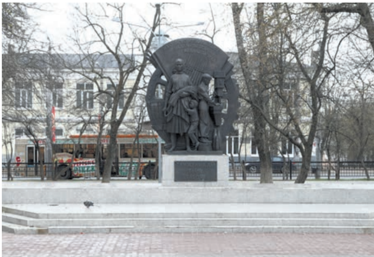
Памятник труженикам тыла в сквере П. А. Воронина.