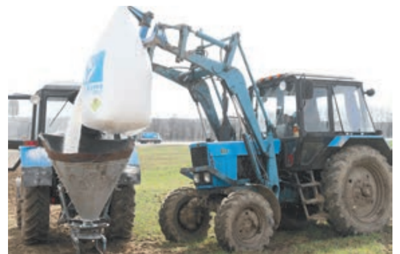
Труд человека заменяют машины.