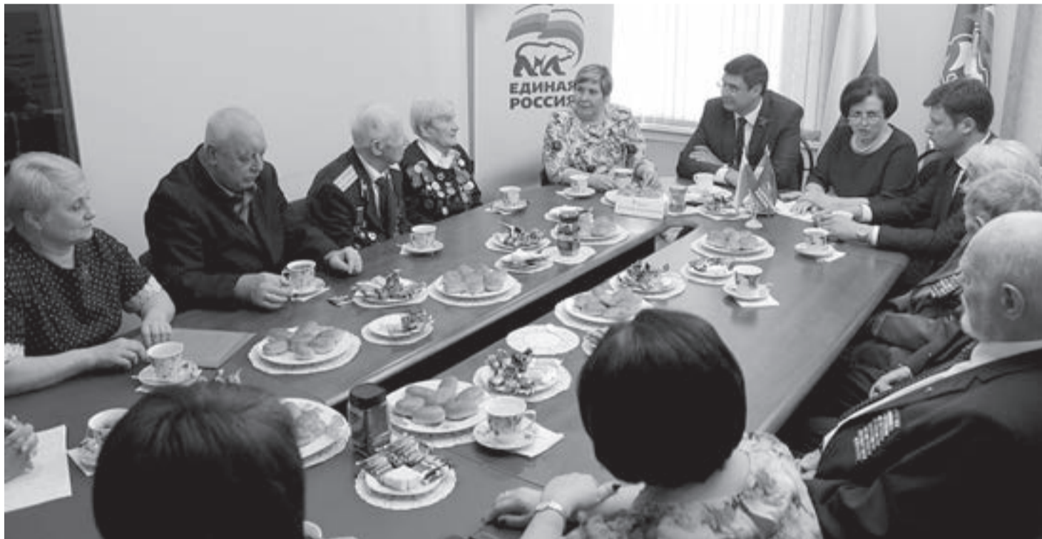
Участники встречи обсудили отчеты о работе поисковых организаций региона.

Участники встречи обсудили отчеты о работе поисковых организаций региона и союза ветеранов Калужской области, выслушали воспоминания ветеранов о событиях Великой Отечественной войны на территории региона. В заключение встречи помимо поздравлений