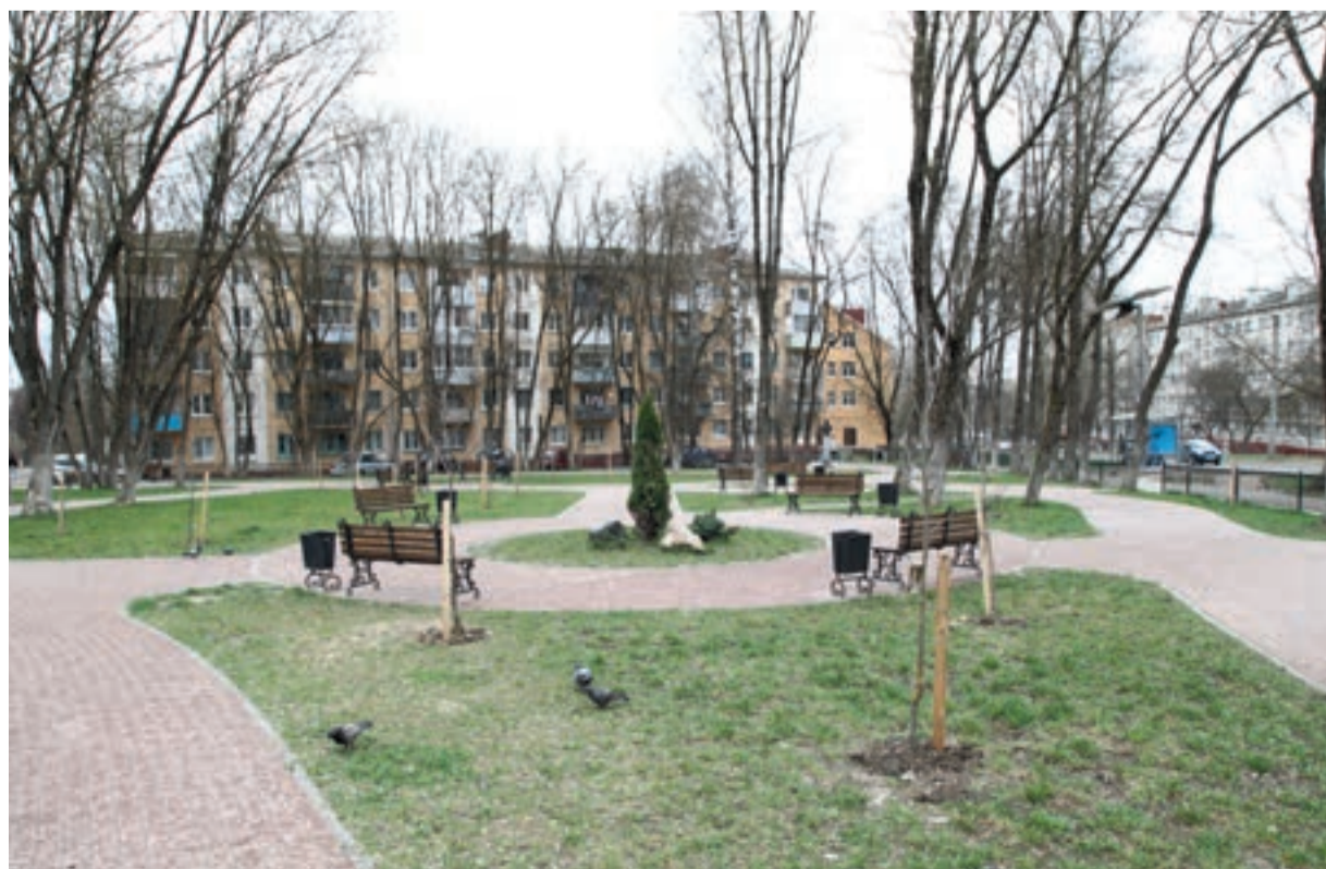
Сквер И. Я. Болдина на улице, носящей его имя.

Герой Советского Союза Николай Иванович Пухов (1895–1958) родился в селе Гришово Бабынинского района Калужской области. Сражался с белогвардейцами в годы гражданской войны, прочно и навсегда связал свою жизнь с Советской Армией. В годы Великой Отечественной войны Пухов командовал 13-й армией, которая проделала победный путь от Ельца до Берлина и Праги. За умелое проведение наступательных боев с форсированием водных рубежей – Днепра, Десны и Припяти – генерал Пухов удостоен звания Героя Советского Союза. 2 февраля 1966 года решением исполкома Калужского городского Совета депутатов трудящихся бывшая Ипподромная улица переименована в улицу Пухова.