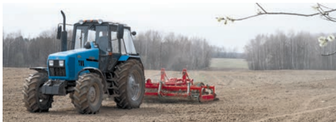
Новая техника позволяет увеличивать урожайность.