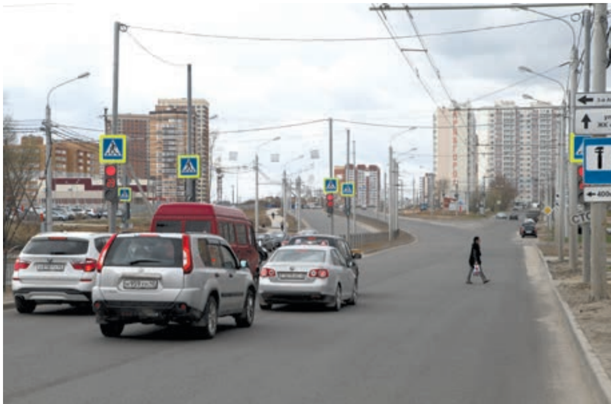
Улица Генерала Попова.