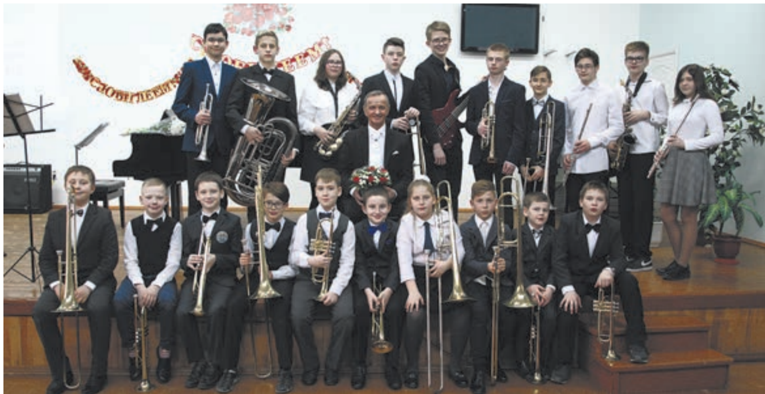
Оркестр «Озорники» – одна большая семья.