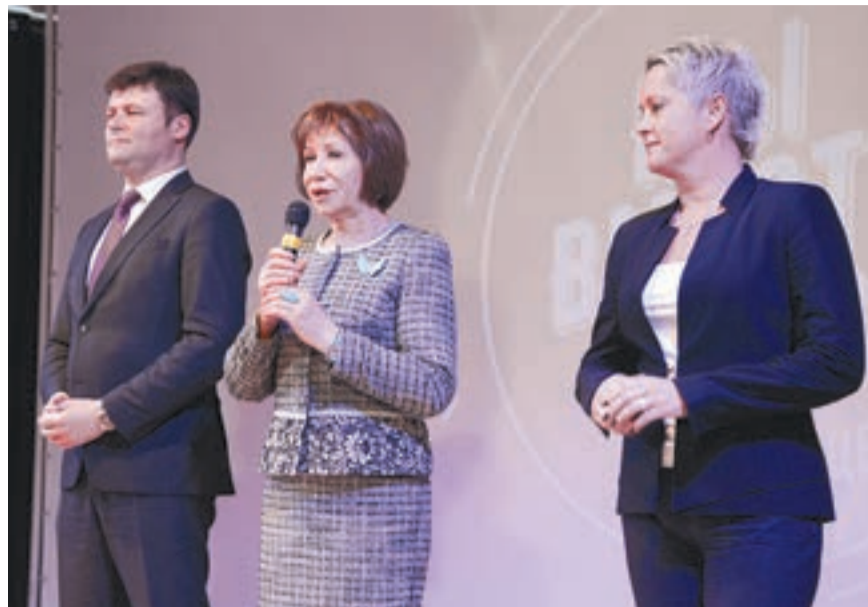
Почётные гости пожелали выступающим успехов.

Закончился гала-концерт награждением лауреатов. Все участники с нетерпением ждут следующего фестиваля и начинают к нему готовиться.