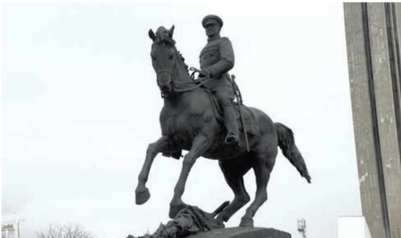
Памятник Маршалу Жукову.