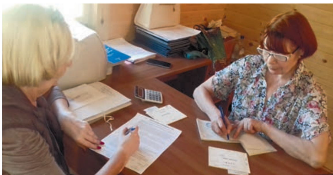
Многие проблемы дачников уже решаются и не только на бумаге.

После трехчасового обсуждения собравшиеся все же внесли множество поправок, и данный бюллетень, наконец, был утвержден. На сегодняшний день процесс голосования идет полным ходом, люди активно выражают свое отношение к будущему садово-огородническому товариществу. Более того, голоса нужно успеть отдать до 18 мая, поскольку уже 20 мая "Заре" грозит отключение от электроснабжения в связи с имеющейся задолженностью в отношении "Калужской сбытовой компании". Собрать с граждан-садоводов всю сумму в указанный срок не представляется возможным, в связи с чем в бюллетене появился третий пункт – заключение договора о беспроцентном займе на сумму 300 тысяч рублей лично с генеральным директором