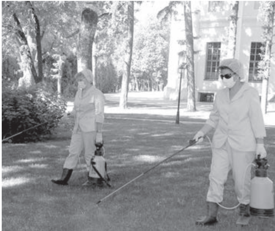
В день работы с ядохимикатами места отдыха закрывают от посетителей.

Многих калужан волнует вопрос: будут ли бороться с клещами в городском бору. Площадь его лесных насаждений составляет 1044 га. Для обработки такого участка нужна авиация и большое количество средств. Поэтому, чтобы не быть укушенным клещом, одевайтесь на прогулки правильно: защищайте все участки тела и голову. На одежду нанесите репелленты. Если все же обнаружили клеща на теле, обязательно обращайтесь к врачу, а клеща сдайте на анализ. Он может быть разносчиком опасного заболевания – боррелиоза.