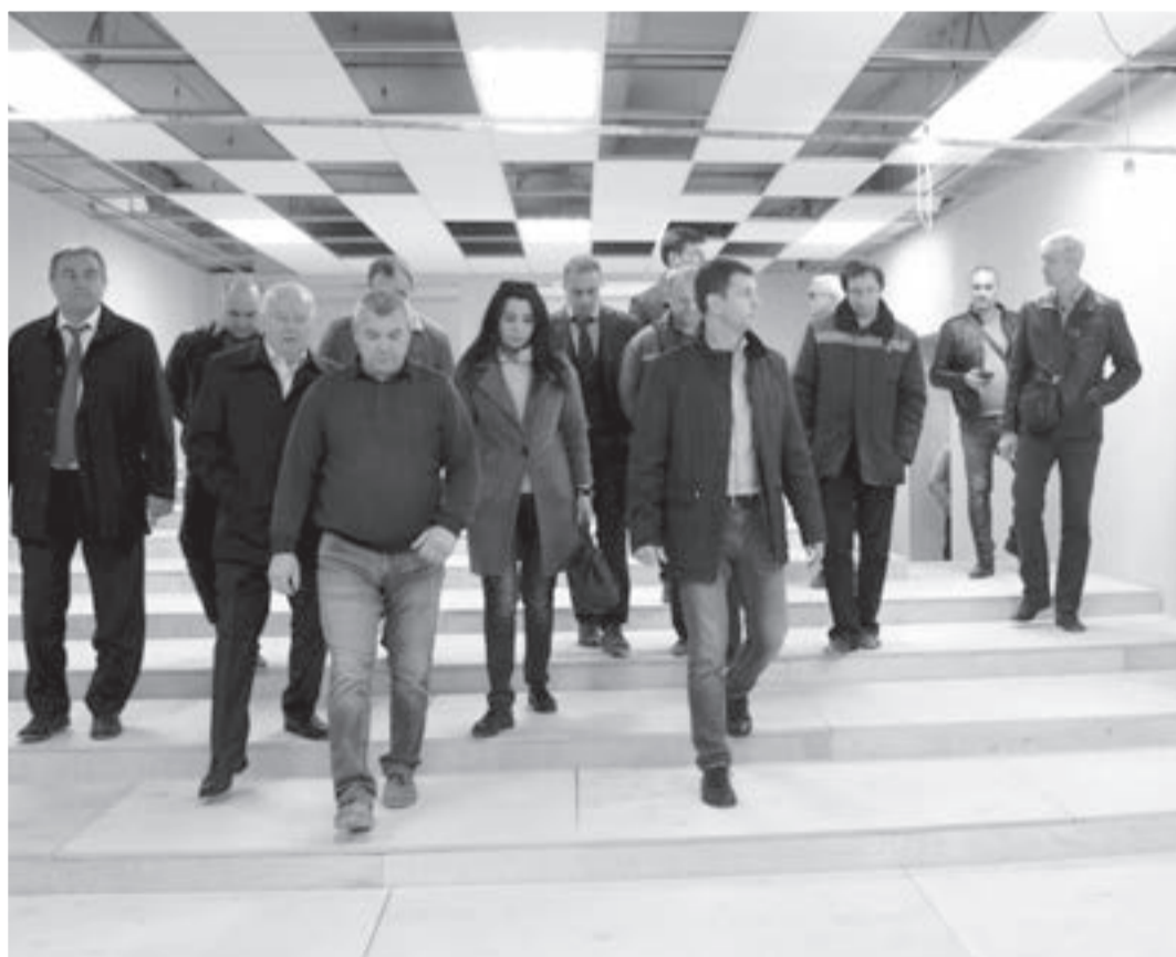
В новом зрительном зале театра кукол.

На прошлой неделе состоялась очередная трансляция интеллектуальной игры «Брэйн-ринг» на канале НТВ.