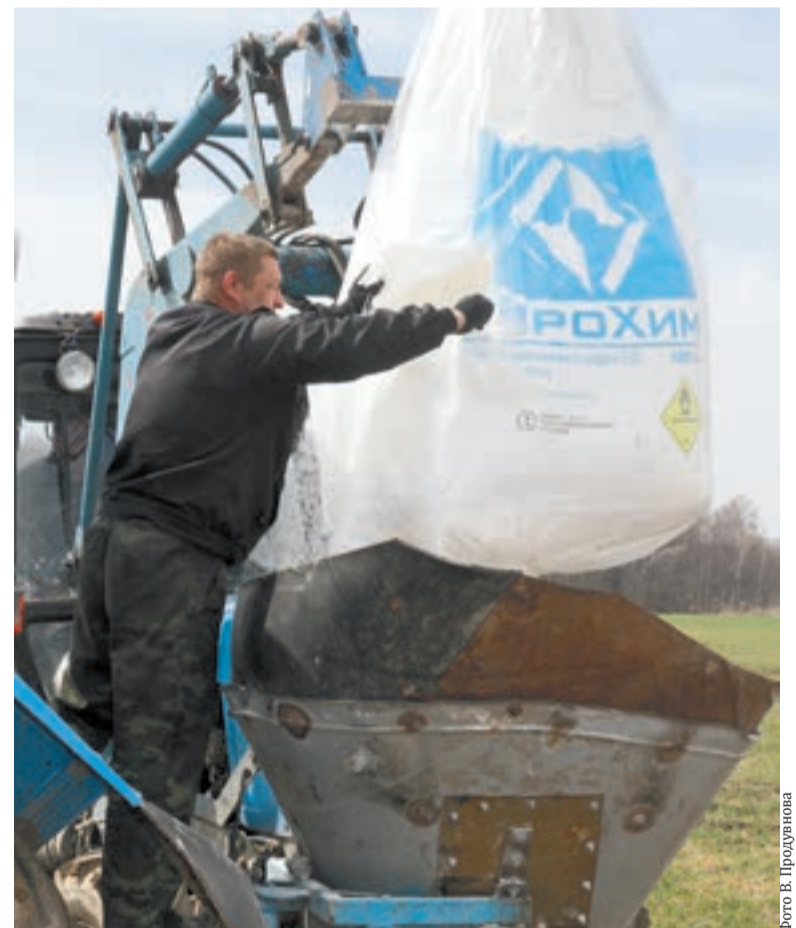
Идет подготовка к подкормке.