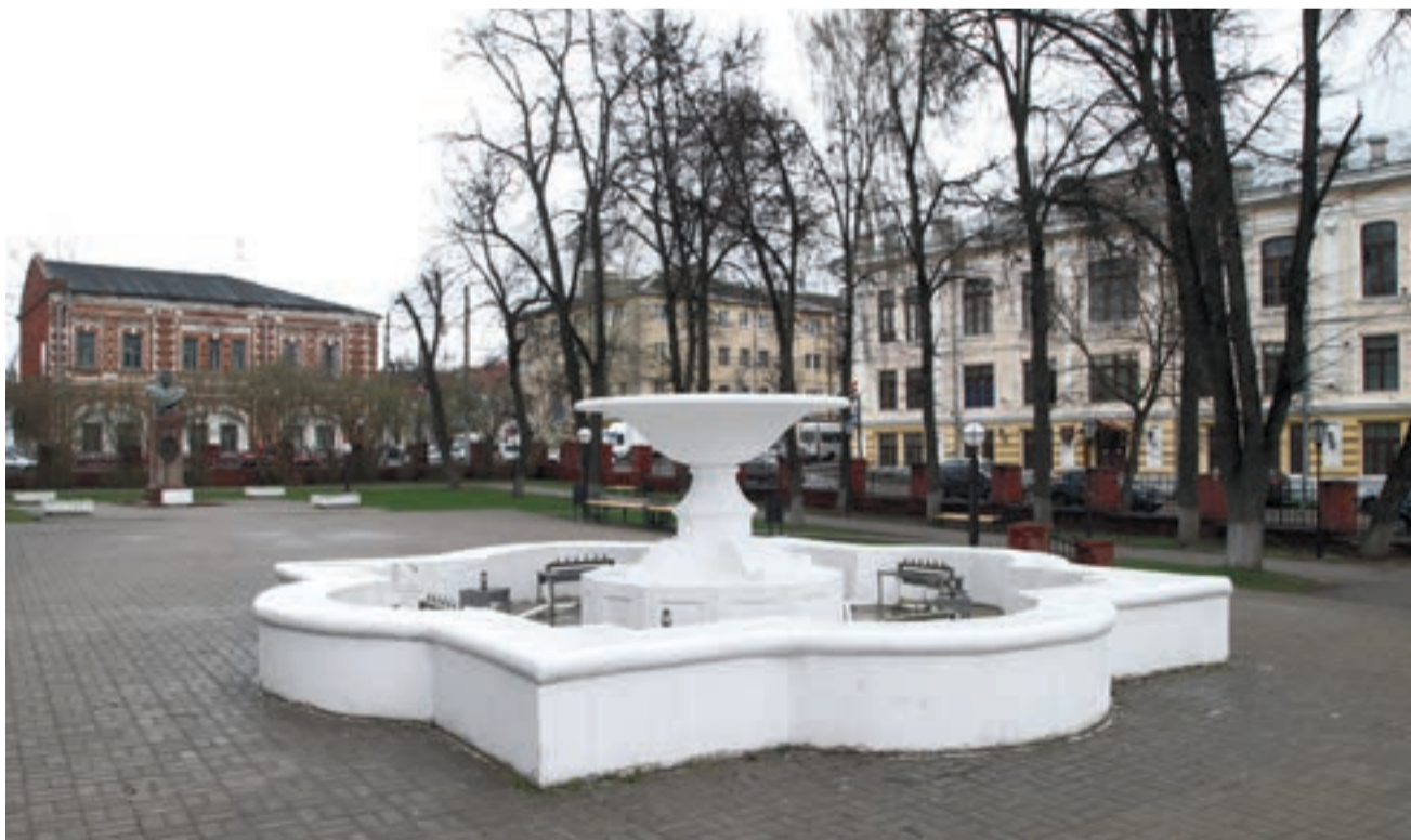
Сквер имени А. Т. Карпова.