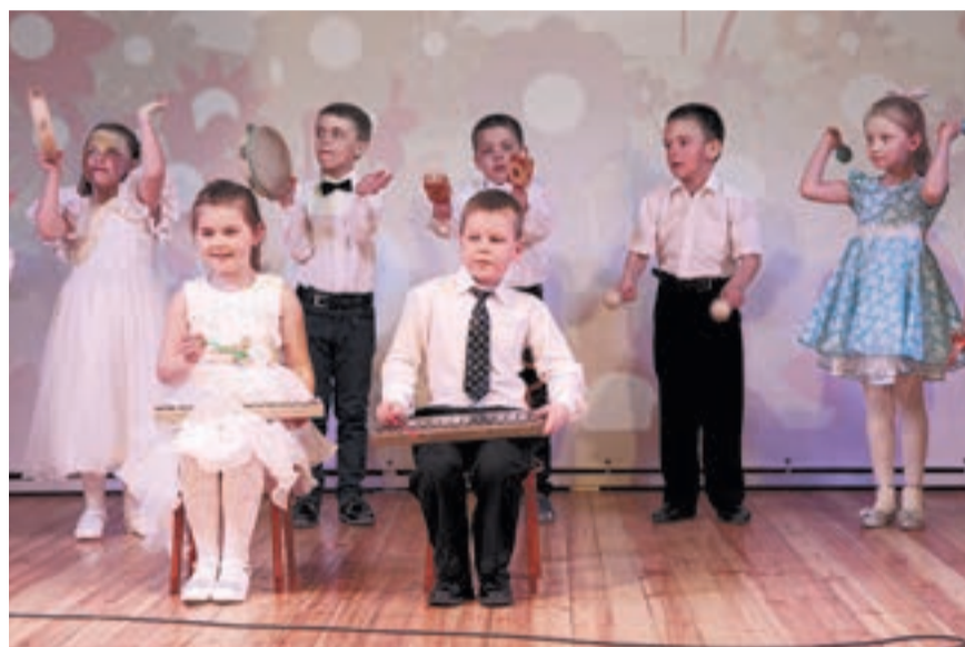
Музыкальный номер встретили аплодисментами.