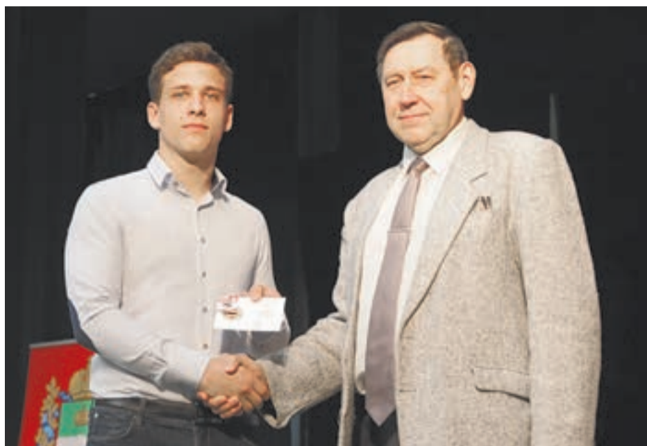
Лучшим вручили знаки отличия.

В управлении физкультуры, спорта и молодежной политики сообщили, что с 2015 года было зарегистрировано 10 000 человек, желающих испытать себя в сдаче норм ГТО. В выполнении нормативов приняли участие 4000 человек. На сегодняшний день на золотой значок их сдали 619 человек, на серебряный – 362, на бронзовый – 242.