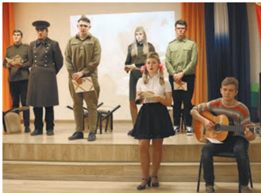
Юное поколение дорожит памятью о предках.

В Калуге прошел смотр-конкурс литературно-музыкальных композиций «Поклонимся великим тем годам», посвященный 75-й годовщине освобождения Калужской области от немецко-фашистских захватчиков.