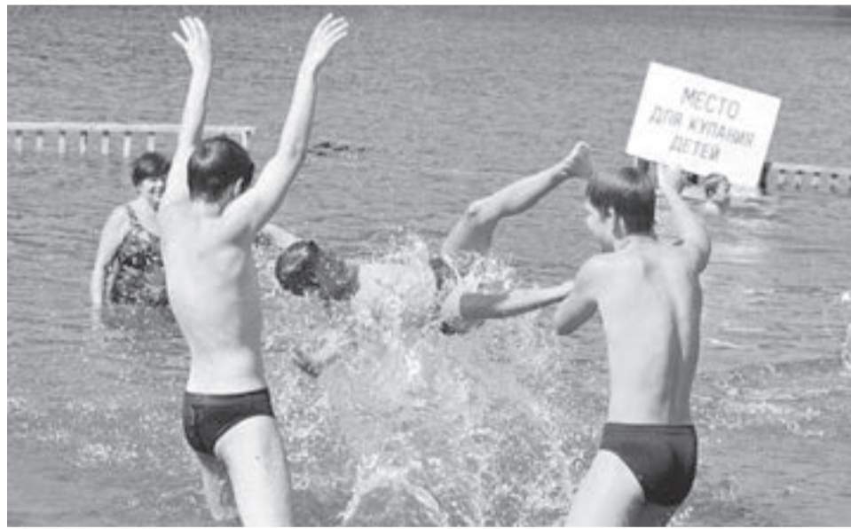
Водоемы таят в себе много опасностей. Будьте осторожны!