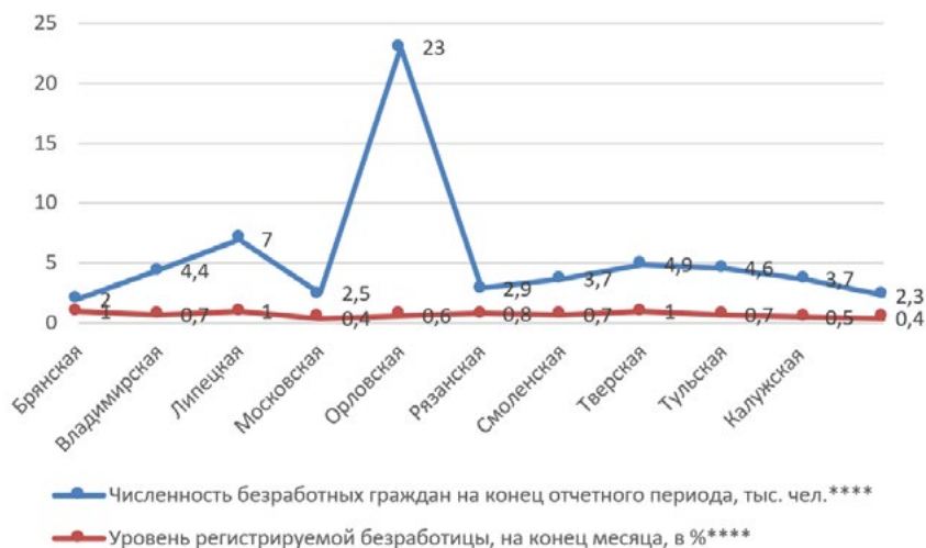
Рисунок 2. Показатели безработицы в регионах ЦФО

Показатели безработицы имеют следующий вид (рисунок 2):