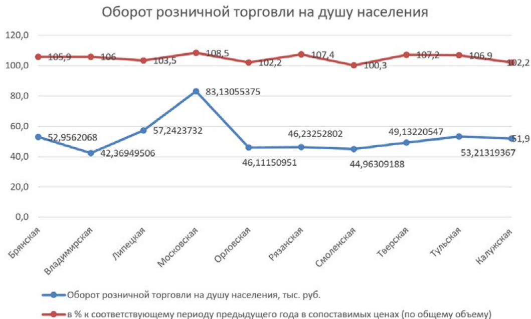
Рисунок 4. Оборот розничной торговли на душу населения в регионах ЦФО

Поддержание, в частности, этих значений относится к приоритетным задачам региональных органов власти, так как именно сфера услуг и отдельные виды розничной торговли пострадали в большей степени в условиях самоизоляции. Причем снижение показателей деятельности в сфере услуг наблюдается уже января-марте 2020 года (рисунок 5).