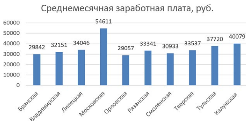
Рисунок 1. Среднемесячная заработная плата в регионах ЦФО, руб.

Калужская область за январь-март 2020 г. занимала 6 место в ЦФО по среднедушевым денежным доходам, которые составили – 31 340,0 и 3 место по среднемесячной заработной плате, что представлено на рисунке 1.