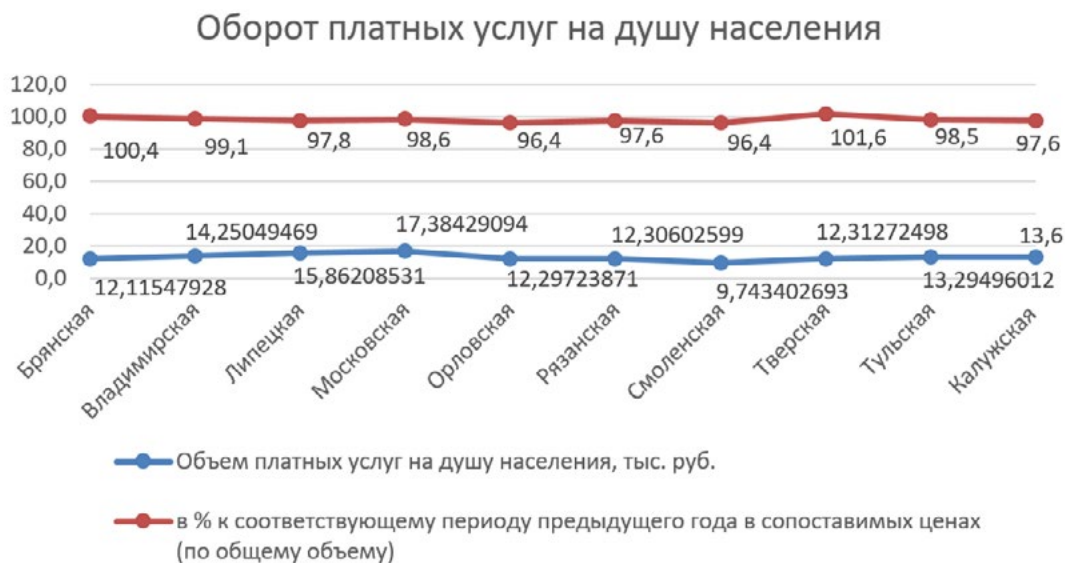
Рисунок 5. Оборот платных услуг на душу населения в регионах ЦФО

Поддержание, в частности, этих значений относится к приоритетным задачам региональных органов власти, так как именно сфера услуг и отдельные виды розничной торговли пострадали в большей степени в условиях самоизоляции. Причем снижение показателей деятельности в сфере услуг наблюдается уже января-марте 2020 года (рисунок 5).