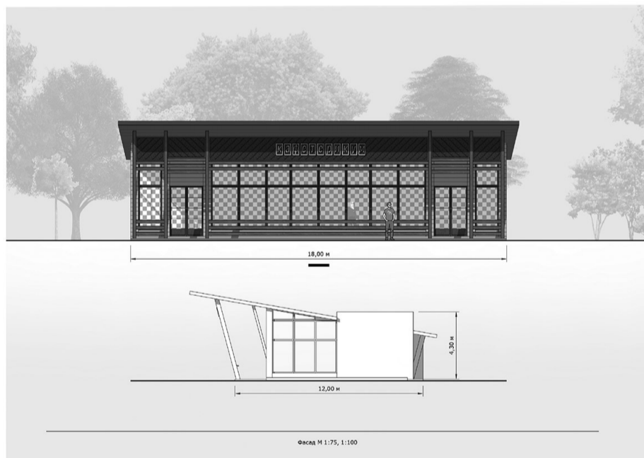
Фасад М 1:75, 1:100