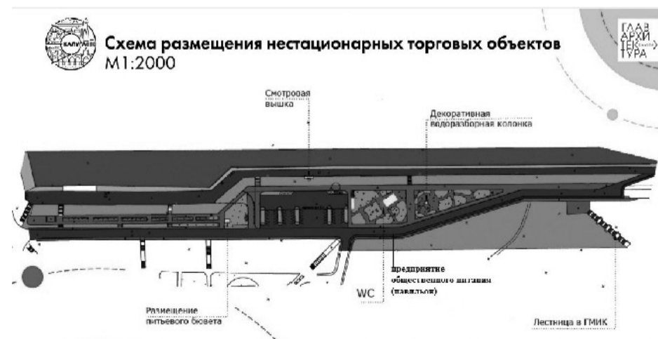
СХЕМА размещения нестационарного торгового объекта на территории муниципального образования «Город Калуга» Лот № 1: г.Калуга, набережная Яченского водохранилища, продукция общественного питания;