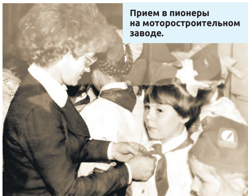
Прием в пионеры на моторостроительном заводе.