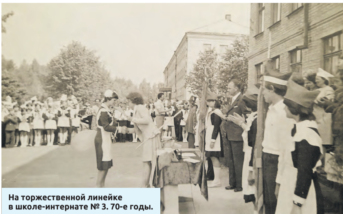
На торжественной линейке в школе-интернате № 3. 70-е годы.