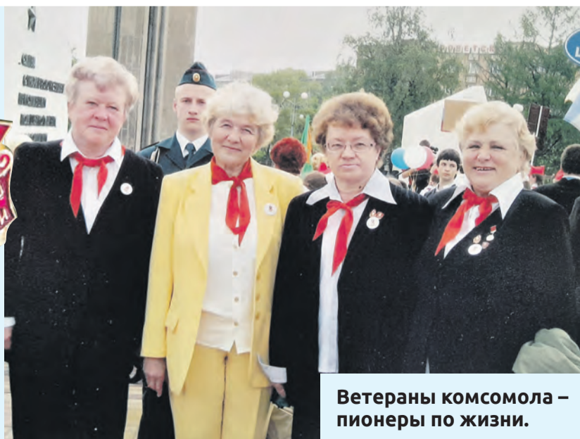
Ветераны комсомола – пионеры по жизни.