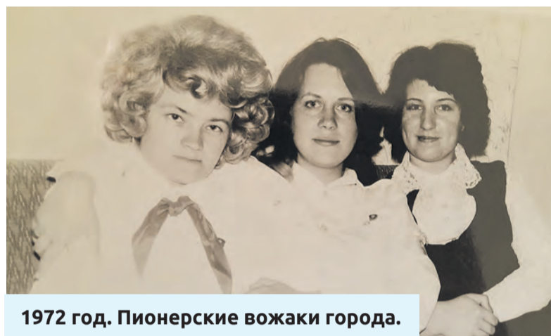
1972 год. Пионерские вожак города.

Тогда секретарь райкома комсомола являлся одновременно и председателем районной пионерской организации – можно сказать, главный пионер района. По роду своей деятельности я курировала все учебные заведения района – школы, техникумы и ПТУ, а также предприятия, которых в то время в Московском районе было немало. Нас так и