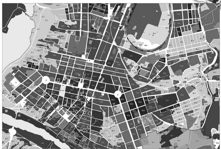
Фрагмент центральной части г.Калуга