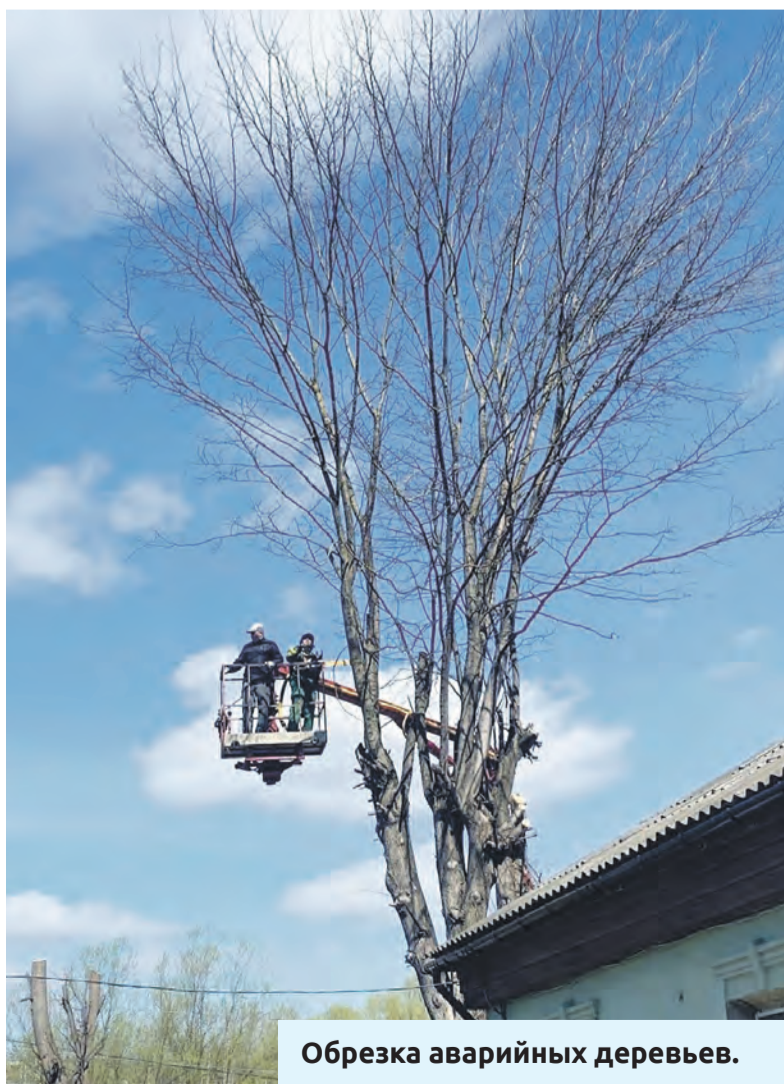
Обрезка аварийных деревьев.

Ольга СМЫКОВА Фото автора и прес-службы Губернатора и Правительства области