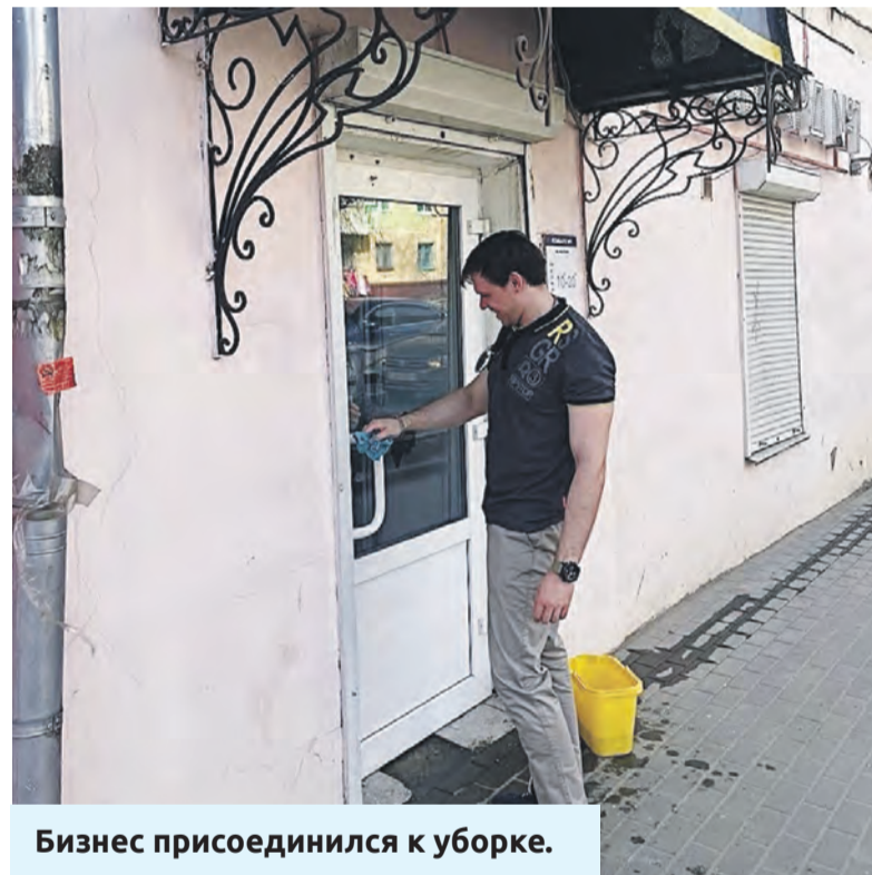
Бизнес присоединился к уборке.

Трудовые коллективы берут под свою ответственность территории социальных учреждений. Так, профсоюзные активисты привели в порядок территорию дома-интерната для престарелых и инвалидов.