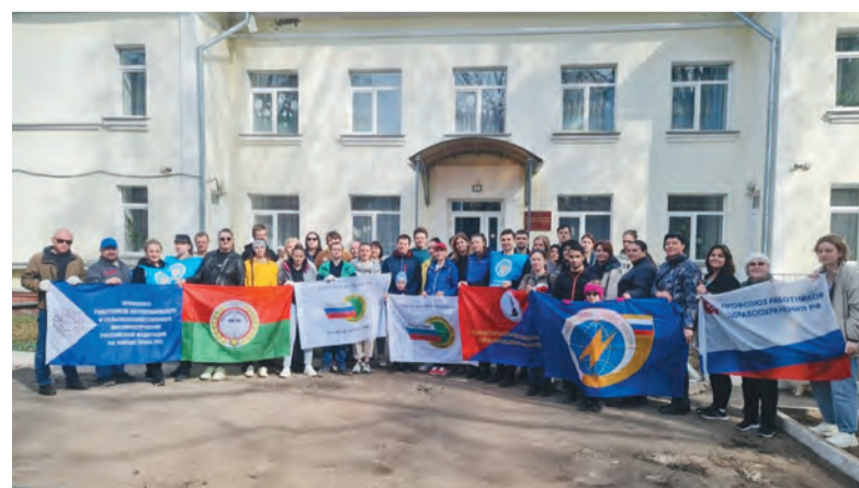
Профсоюзы привели в порядок территорию дома-интерната.