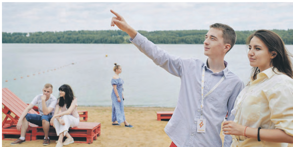
Ольга КУЗЬМИНА

Студентам, которые хотят развиваться в проектной деятельности, я советую зайти на сайт Федерального агентства по делам молодежи. Именно там представлены основные активности: проекты, конкурсы и программы. Стоит попытать свои силы в конкурсе «Твой ход». Кроме того, от правительства Российской Федерации реализуется программа «Студенческий стартап»: ежегодно более тысячи студентов могут воплотить в жизнь свою задумку и получить на это миллион рублей грантовых средств. Сегодня очень много возможностей для нашей молодежи!