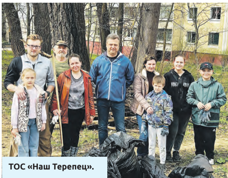
ТОС «Наш Терепец».

Денисов, отметив, что весенняя уборка Березуйского оврага стала доброй традицией для горожан.