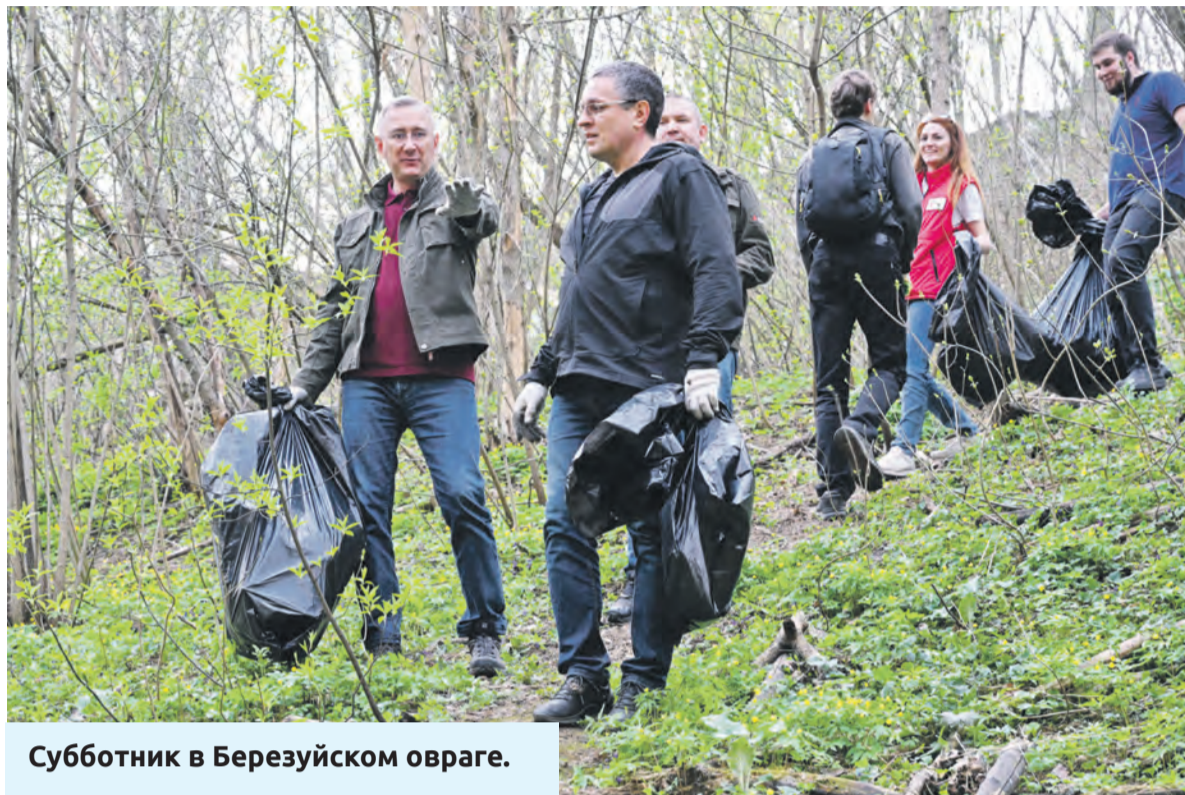
Субботник в Березуйском овраге.