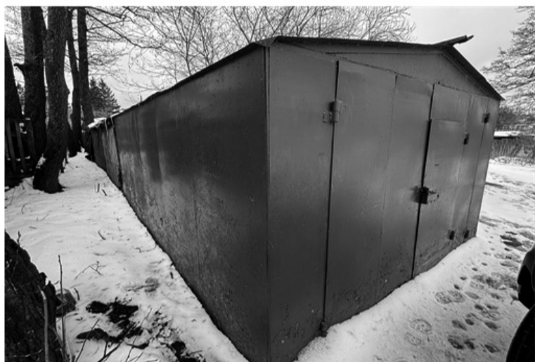
Фото 1 Фото 2

Металлические гаражи, расположенные по адресу г.Калуга, ул. Калужка, район д. 6а