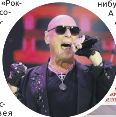
22–29 мая 2026 г. ФИЛАРМОНИЯ ОТКРЫТИЕ ФЕСТИВАЛЯ «МИР ГИТАРЫ» С JOE LYNN TURNER. BABYLON

– В моей большой итальянской семье все не просто любили музыку и пели, но каждый играл на каком-нибудь инструменте. А бабушка даже на стиральной доске такие ритмы вытворяла! Семья