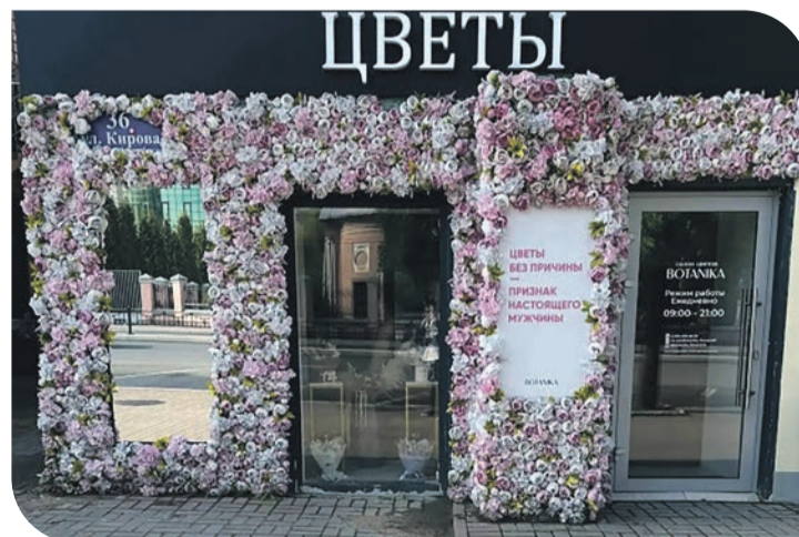
Подготовила Ольга АНДРЕЕВА