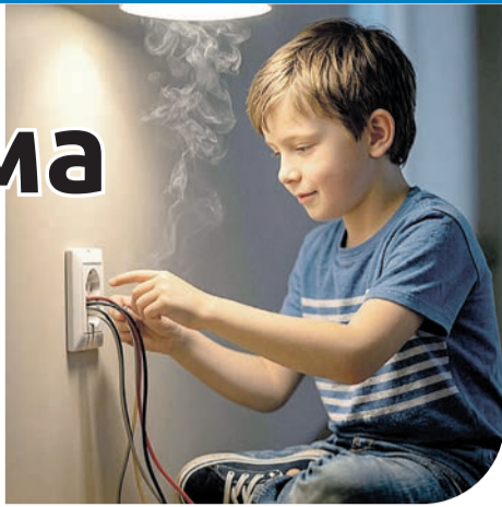
Фото сгенерировано нейросетью

Советы родителям, как обезопасить ребенка от травм, когда он остается дома без присмотра.