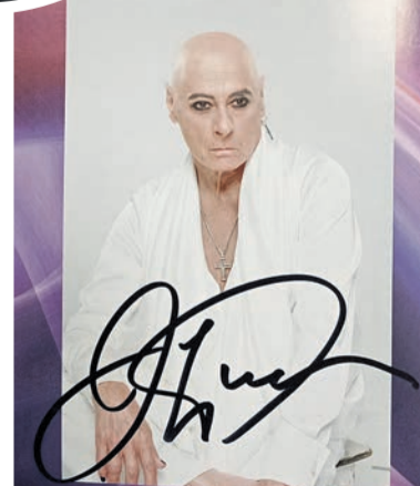
Оставил автограф на память и пожелал читателям газеты «Калужская неделя» удачи и вдохновения.